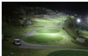
[다크 이구아나 카메라]